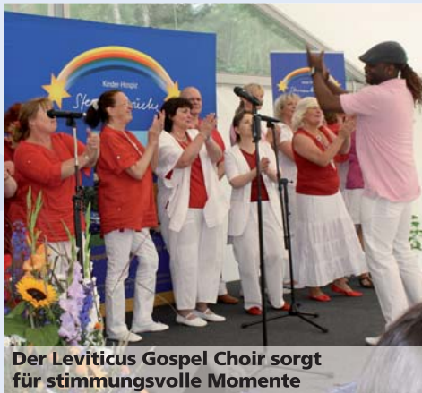
Der Leviticus Gospel Choir sorgt für stimmungsvolle Momente

Weitere Informationen zu unserem Ambulanten Kinder-Hospiz Pflegedienst finden Sie auf unserer Internetseite.