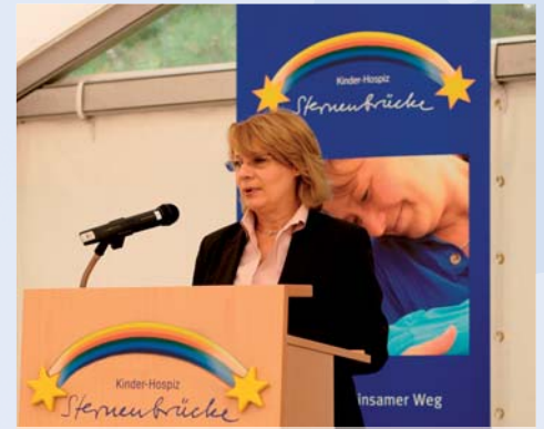
Senatorin Cornelia Prüfer-Storcks würdigt die Arbeit der Sternenbrücke