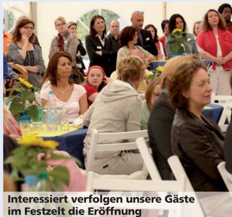
Interessiert verfolgen unsere Gäste im Festzelt die Eröffnung